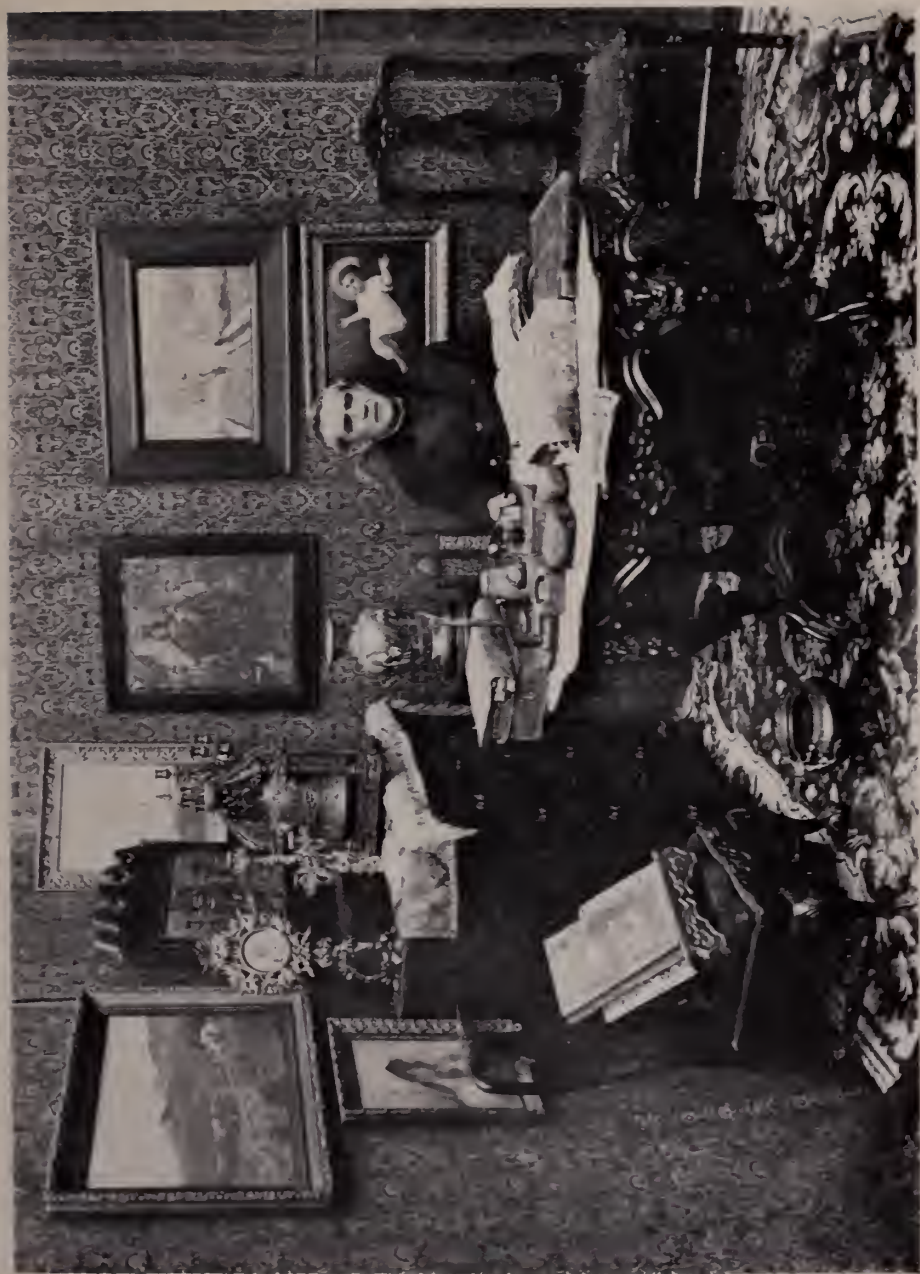
MONSEÑOR PABLO CABRERA EN 1927.